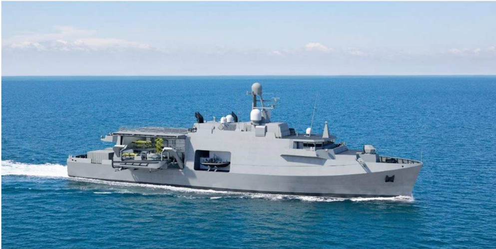
Artist impression nieuw mijnenbestrijdingsvaartuig—Naval Group.

In de vorige nieuwsbrief was een verwijzing opgenomen naar het artikel in de Alle Hens over de HLD's aan boord van de mijnenbestrijdingsvaartuigen. Wat is begonnen als een pilot en uiteindelijk door zowel de Mijndienst als de betrokken LD-ers als geslaagd is ervaren, heeft recent geleid tot een besluit om de HLD-functie ook daadwerkelijk op te nemen op de bemanningslijst van de nieuwe mijnenbestrijdingsvaartuigen. Mooi nieuws dus voor met name de jonge LD officieren!